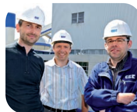
L'équipe de direction de CBR Gand

Deux types de ciments sont fabriqués à l'usine de CBR Gand : CEM I (ciment Portland) et CEM III (ciment de haut fourneau). Deux sortes de CEM I et six sortes de CEM III y sont produites. Les produits finis à base de ciment de haut fourneau sont principalement utilisés pour des applications durables. La majeure partie du ciment produit à Gand est destinée au marché belge. Le marché naturel se situe dans un rayon de cinquante kilomètres autour de l'usine. En 2008, 88,3% de la production ont été destinés à la Belgique et plus de 11% ont été exportés, principalement vers les Pays-Bas et le nord de la France. Ces dernières années, la quote-part des exportations a considérablement baissé en raison de la redistribution des flux de ciment au sein de HeidelbergCement Benelux.