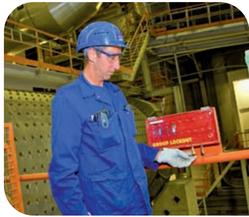
Les observations sécurité sont menées de manière hebdomadaire