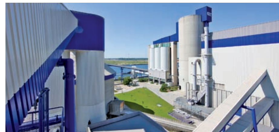
CBR Gand est une usine ultramoderne, la plus automatisée du secteur à l'échelle internationale