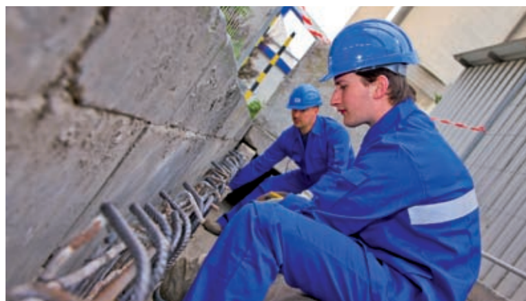
L'entreprise attache une grande importance à la sécurité

Le concept du broyage du ciment en deux phases de la nouvelle usine permet de réaliser une économie d'énergie de 20% par rapport à la méthode classique de broyage du ciment