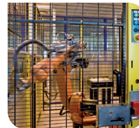
Le contrôle qualité est entièrement automatisé