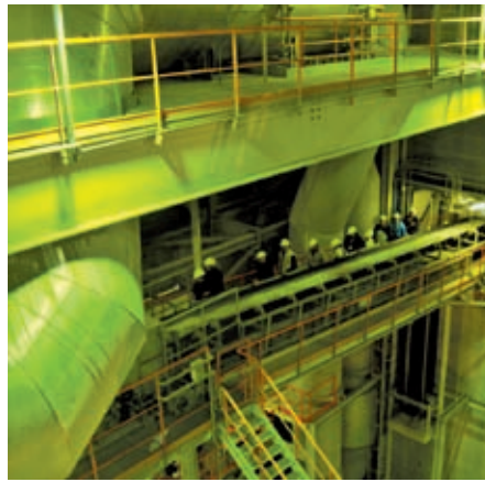
Journée Découverte Entreprises à CBR Gand