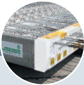
Balkon als Halbfertigteil mit Faseraufkantung und Isokorb.