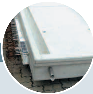
Massivbalkon mit Aufkantung, Wärmedämmelement (Isokorb), innenliegender Rinne und Wasserspeicher.