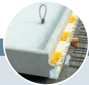
Massivbalkon mit umlaufender Aufkantung über Deckenhöhe und Isokorb.