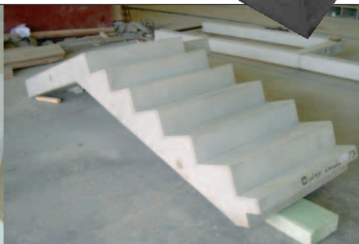
Treppenlauf mit angeformtem Podest oben