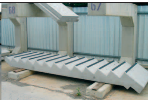
Treppenlauf mit Rutschkanten