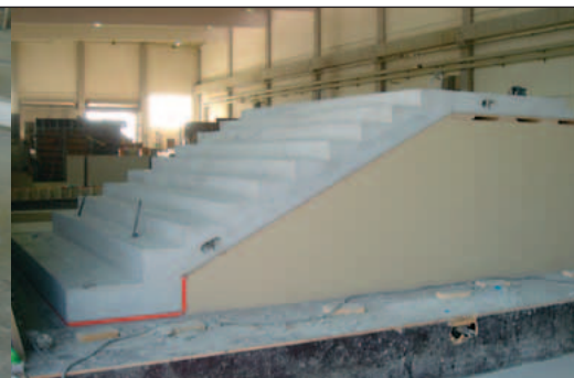
Treppenlauf mit angeformtem Podest oben und unten