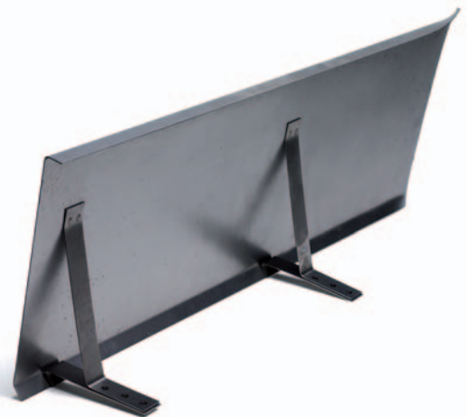
Kantform Kan förses med utanpåliggande räckesfäste