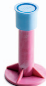
Dubbrör Innerdiameter Ø12mm