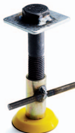
Fäste/hylsa för hissöglor För M20 skruv