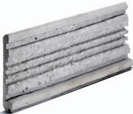
Betongavstängare Fiberarmerad betong