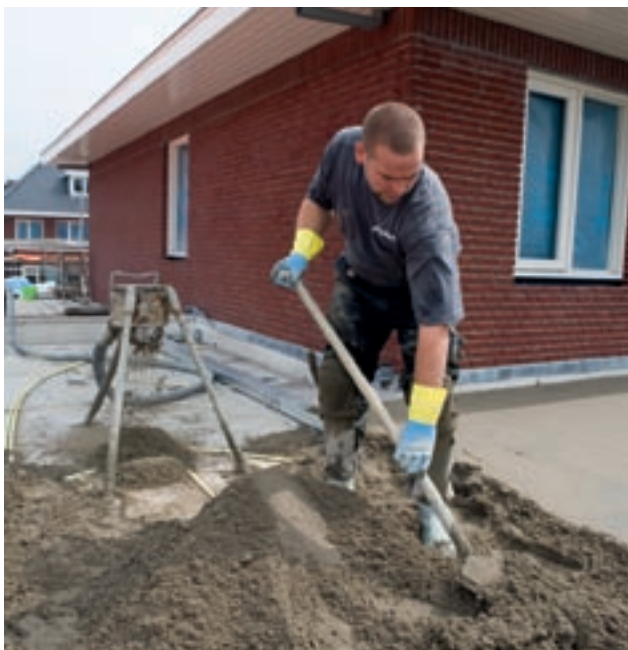
Malaxez d'abord le sable et le ciment à sec

Malaxez d'abord le sable et le ciment à sec, ajoutez de l'eau pour obtenir un mélange à consistance terre humide (voir composition).