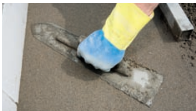
Finition: égalisez la surface avec une palette en acier