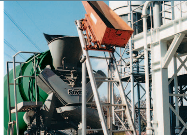
Faserzugabe im Transportbetonwerk