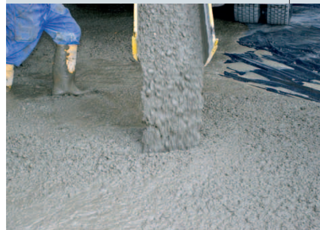
Zügiger Betoneinbau in der gewählten Konsistenz