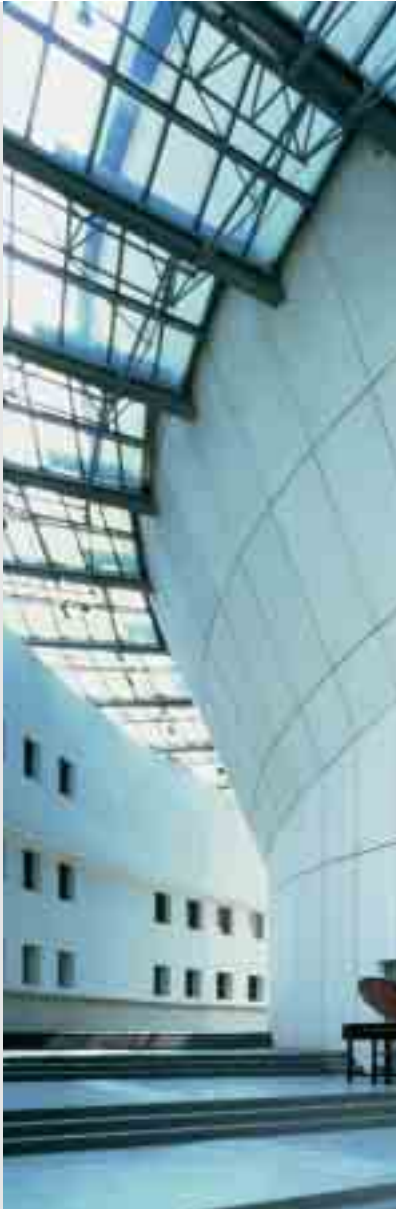
Foto: Cité de la Musique in Paris - geplant von dem Architekten Christian de Portzamparc.

Gedruckt auf umwelt- freundlichem, chlorfrei gebleichtem Papier