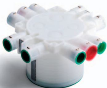
Takdosa E14 206 40