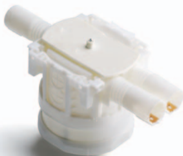
Apparatdosa E14 242 05