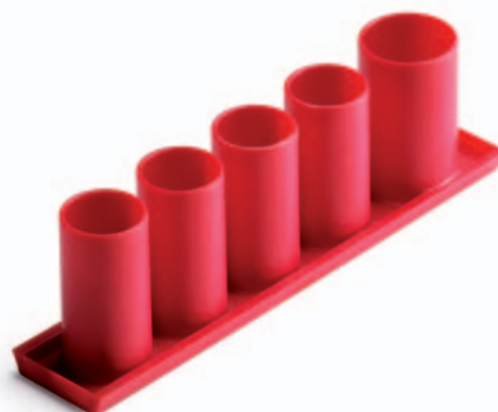
Elgenomföring 4x Ø20mm, 1x Ø25mm