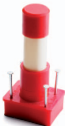
Genomföringsmuff E14 007 08