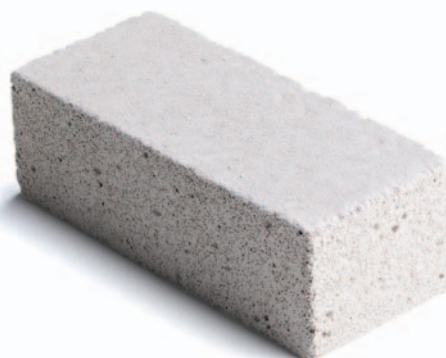
Elgenomföring lättbetong 75x150x50, 150x150x50